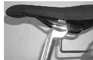
Patentsattelstütze mit Inbussbefestigung

Viele Sattelstützen werden heute mittels eines Schnellspannverschlusses befestigt. Durch Umliegen des Spannhebels können Sie die Sattelstütze lösen und herausziehen. Statt eines Schnellspanners kann die Sattelstütze an der Sattelrohrmuffe auch mittels einer Inbusschraube geklemmt werden. An Patent-Sattelstützen befindet sich eine Inbusschraube, mit der Sie die Neigung und Position (vor oder zurück) einstellen können. Nach erfolgter Einstellung die Inbusschraube mit einem geeignetem Inbusschlüssel wieder fest anziehen. Die optimale Sattelleigung hängt vom individuellen Empfinden ab. In der Regel sollte der Sattel waagrecht eingestellt sein, um Arme und Handgelenke zu entlasten.