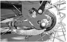
Drei-Gang-Nabenschaltung mit Bremsarmbefestigung am Rahmen

Bei Rücktrittbremsnaben ist die Bremse für das Hinterrad in der Nabe eingebaut. Diese Art der Bremse ist äußerst zuverlässig und weitgehend wartungsfrei. In der Regel werden Cityräder mit einer V-Bremse am Vorderrad und einer Rücktrittbremsnabe am Hinterrad ausgestattet. Es ist jedoch auch eine Kombination von zwei V-Bremsen und einer Rücktrittbremsnabe möglich.